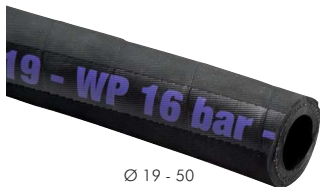
Ø 19 - 50